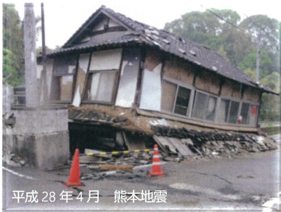
平成28年4月 熊本地震