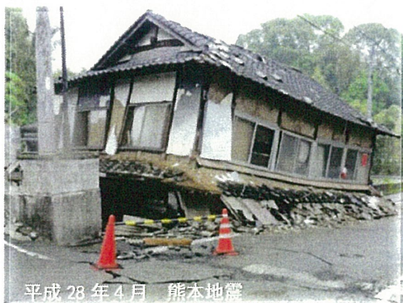
平成 28 年 4 月 熊本地震