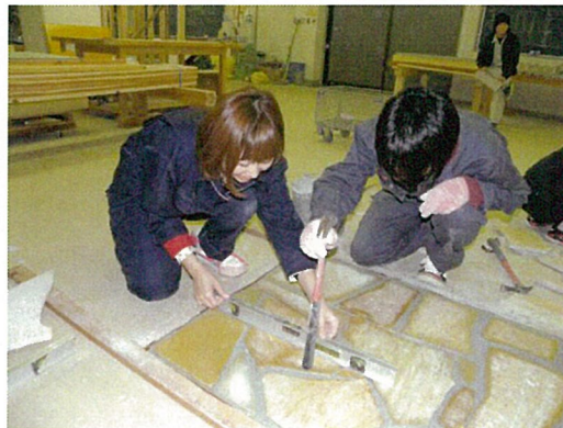
【エクステリア実習】