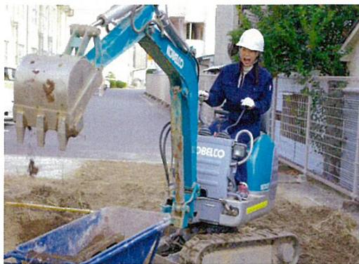
【建設機械操作実習】