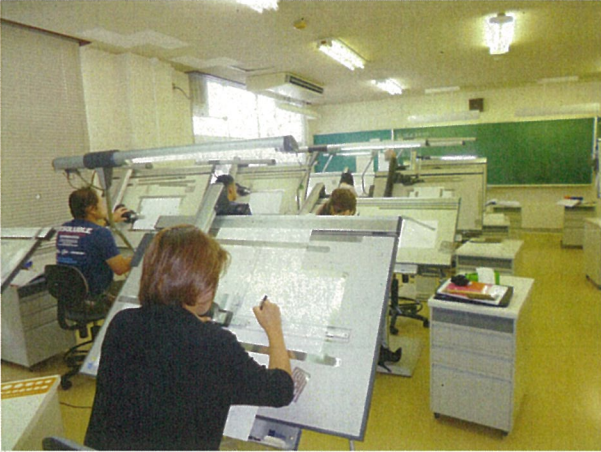
製図（トレース）の訓練