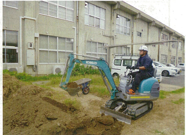
車両系建設機械特別教育の実施