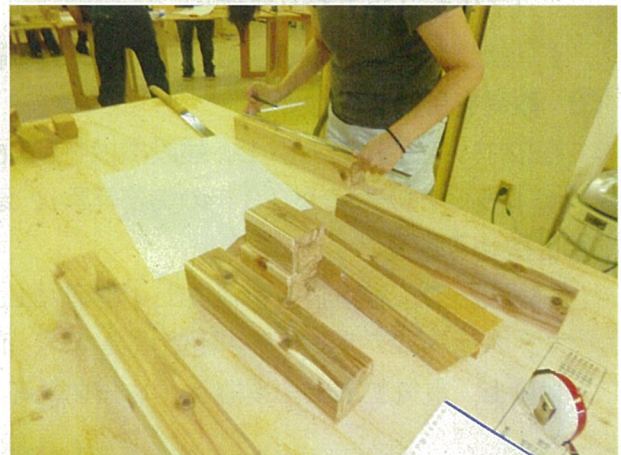
建築大工3級課題に挑戦