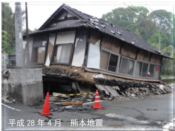
平成 28 年 4 月 熊本地震