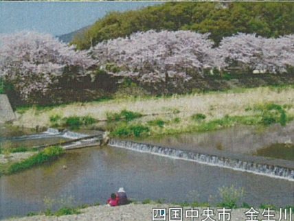
四国中央市 金生川