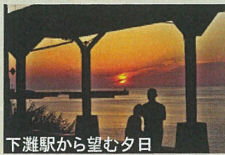
下灘駅から望む夕日

プロフィール 1944年生。旧双海町職員として、夕日をコンセプトに他では真似できないアイデアで地域づくりを手掛けた。退職後は「人・家族・地域の再生」をテーマに私塾「人間牧場」の牧場主(塾長)を務める。