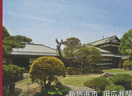
新居浜市 旧広瀬邸