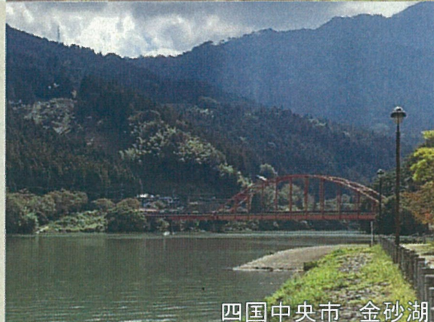
四国中央市 金沙湖