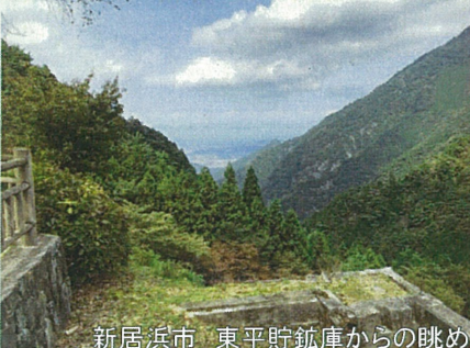
新居浜市 東平貯鉱庫からの眺め