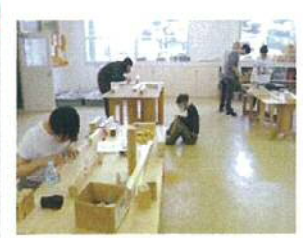
建築大工技能検定 3級実技課題