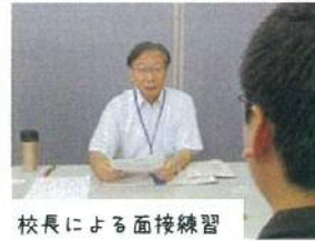
校長による面接練習

訓練も中盤にさしかかり、通常の訓練に加えて就職活動や職場実習の機会が増えてきました。