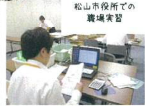
松山市役所での 職場実習

就職が決まり、退校する訓練生もいます。 そのような仲間との良い思い出づくりの 時間となりました。