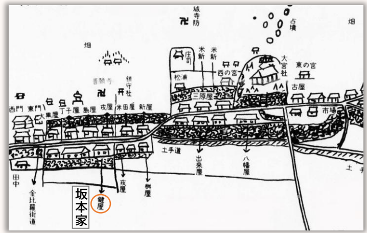
明治以前の川上駅及び屋号の絵図（川内町新誌294頁より）